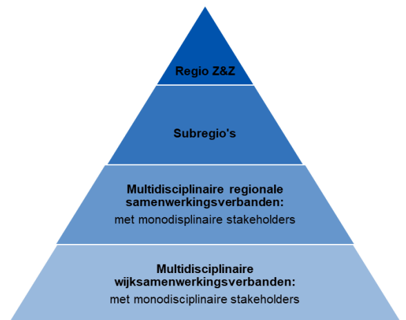
Figuur 1 Multidisciplinaire regio-organisatie

Voor een goede multidisciplinaire organisatie is een goede monodisciplinaire organisatie van de paramedische beroepsgroepen essentieel. Monodisciplinaire samenwerking maakt het mogelijk om als belangrijke stakeholder in de regio te acteren, de belangen van de beroepsgroep te behartigen en regionaal multidisciplinair aan te haken. Een monodisciplinaire organisatie kan: