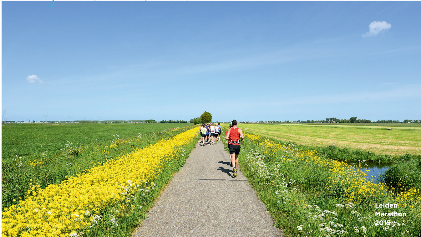
Leiden Marathon 2015